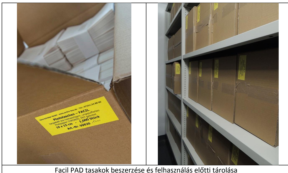
Facil PAD tasakok beszerzése és felhasználás előtti tárolása

Osztályunk archívuma számos olyan műről őriz fotódokumentációt, amely időközben már kikerült a gyűjtés- és művészettörténet látóköréből. E képanyag sok esetben egyetlen forrásként szolgálhat műtárgyak provenienciájának kutatásához és hatósági adatigénylésekhez. Ezért kiemelten fontos az állagvédelem és a korszerű tárolás és csomagolás biztosítása. A fotódokumentáció 1958-tól egészen a közelmúltbeli digitális átállásig folyamatosan bővült. A korábbi csomagolóanyagok, borítékok, papírtasakok már savasodásnak indultak. Az ezüst-zselatinos nagyítások emulziójának megóvása érdekében a csomagolóanyagok cseréje, illetve a különféle hordozók elkülönítése is szükségessé vált.