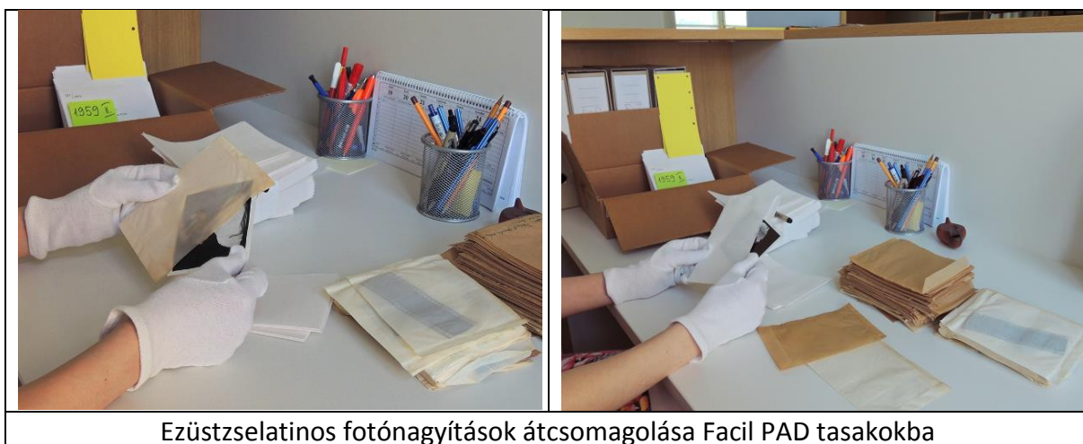
Ezüstszelatinos fotónagyítások átcsomagolása Facil PAD tasakokba

Az átcsomagolás folyamán a műtárgyvédelmi előírásoknak megfelelően munkatársaink cérnakesztyűben helyezték át az üvegnegatívokat a régi, már töredezett, szakadozott, elszennyeződött borítékokból az új tasakokba. Amennyiben szükséges volt, a leltári számokat és további adatokat archiváló tollal vezették át a nagyítások verso oldalára.